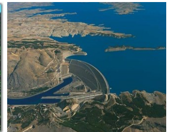
Atatürk Baraj Gölü