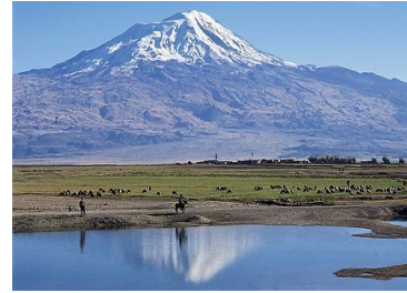
En yüksek dağımız ..... dağı ↑