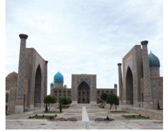
Ulughbey Medresesi - Semerkant

• Türkler, İslam öncesi dönemde cihan hâkimiyeti düşüncesine sahip idi. Bu düşünce, İslamiyet'in kabul edilmesinden sonra cihat/gaza anlayışı ile devam ettirildi.