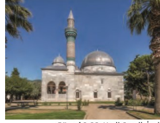
Görsel 2.33: Yeşil Camii, İzmit

• Türk-İslam mimari tarzında birçok cami, medrese, imarethane, darüşşifa, hamam, bimarhane... inşa edildi.